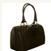
Bolso en Piel de Cocodrilo grabada €175.00